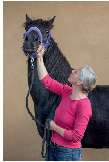
Reagiert ein Pferd dergestalt auf den Halftergriff, ist Training vonnöten.

Wenn man einen Tiger dazu bringen kann, sich an ein Gitter zu legen, um seinen Schwanz herausziehen und abbinden zu lassen und dann Blut aus der Vene zu entnehmen, warum sollte diese Vorgehensweise nicht auch bei einem seit Jahrtausenden domestizierten Tier wie einem Pferd funktionieren?