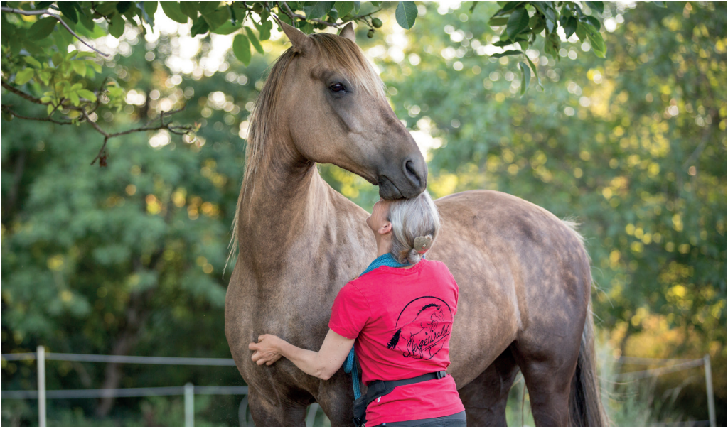
Das Kraulen der Lieblingsstelle lässt Pferde sofort reagieren.