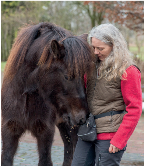
So möchte man es niemals im Training haben!