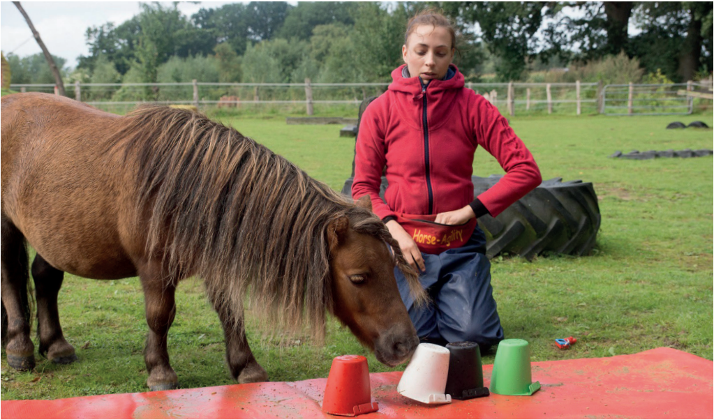
Eine Farbunterscheidung lässt sich mit den Methoden der operanten Konditionierung leicht trainieren.

Das können angenehme, aber auch unangenehme Konsequenzen sein. Sie lernen in beiden Fällen. Ein Beispiel: Sie setzen sich ins Auto und fahren los. Nach ein paar Metern beginnt der Wagen penetrant zu piepen. Ups! Sie sind nicht angeschnallt, haben aber auch keine Lust, sich einengen zu lassen. Nun machen Sie die Erfahrung, dass das Piepen zunehmend lauter und durchdringender wird, bis Sie augenrollend nach dem Gurt greifen und den Verschluss zuschnappen lassen. Aah, nun, endlich herrscht Ruhe! Erleichterung macht sich breit. Sie werden sich vermutlich das nächste Mal, wenn Sie sich ins Autos setzen, sofort daran erinnern, den Gurt zu schließen, um dem nervigen Gepiepe zu entgehen. Das Anlegen des Gurtes wurde bei Ihnen operant antrainiert.