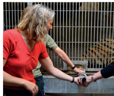
Es ist wirklich faszinierend, was mit Training alles möglich ist.