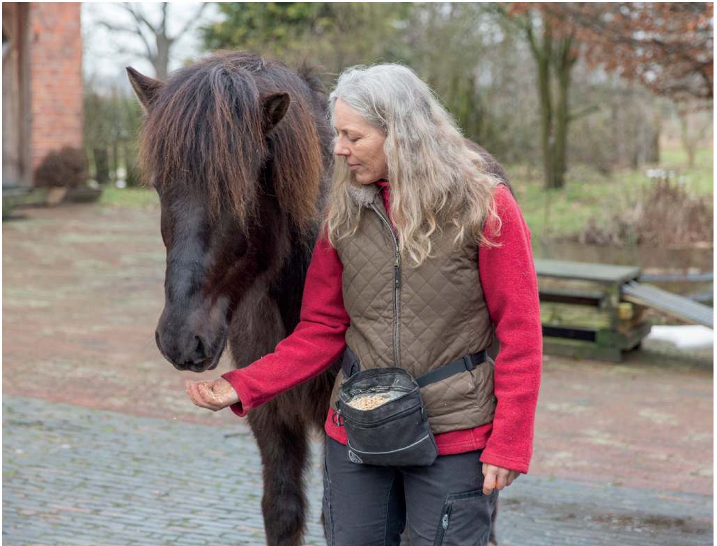
Ein Grundsatz: Mittiges Anreichen des Futters.