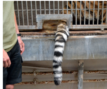
Das Stillhalten des Schwanzes ist für sich schon eine Trainingsaufgabe bei Katzenartigen.