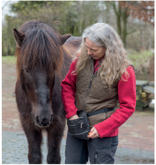
Schon besser, obwohl Frekjas Hals immer noch zum Menschen geneigt ist.