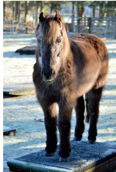
Auch mit 38 Jahren kann ein Pferd Neues lernen.

In diesem Beispiel hat in den Wochen zuvor ein Lernprozess stattgefunden: Die infernalische Bimmelkeit kündigt die Ankunft des Eismanns an. Sie können loslaufen und sich eine leckere Erfrischung kaufen. Bei Ihrer unwillkürlichen Reaktion auf das von Haus aus eigentlich völlig unbedeutende Gebimmel handelt es sich um eine so genannte »klassische Konditionierung«. Sie beschreibt die unwillkürliche oder reflexhafte Reaktion auf einen vormals bedeutungslosen Reiz.