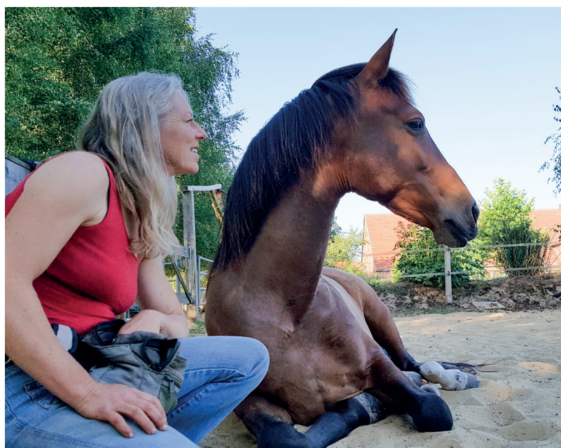
Ein geschultes Pferd ist in jeder Lebenslage voller Vertrauen.

Medical Training ist für alle Pferde jeder Altersgruppe nicht nur geeignet, sondern sollte verpflichtend für Halter, Züchter und Trainer sein: Die Grundlage auf der Verhaltensebene ist stillzustehen und sich dann auf vielerlei Arten untersuchen und behandeln zu lassen. Auf emotionaler Ebene geben Sie Ihrem Pferd Vertrauen: Es lernt, dass Sie auf seine Bedürfnisse und Ängste eingehen und es freundlich und fair auf seinem Lernweg begleiten.